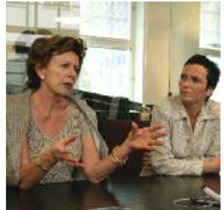
EUs konkurransekommissær Neelie Kroes og fornyings- og administrasjonsminister Heidi Grande Røys drøftet konkurransepolitikk under Kroes' norgesbesøk i sommer.

Konkurransesituasjonen i IKT-sektoren var blant de konkurransepolitiske spørsmålene som ble belyst i diskusjonene. I en felles erklæring etter møtet understreket EU-kommissæren og statsråd Grande Røys at IKT-sektoren har kjennetegn som lett gjør den utsatt for konkurransehindrende virksomhet, og at den derfor må følges nøye av konkurransemyndighetene.