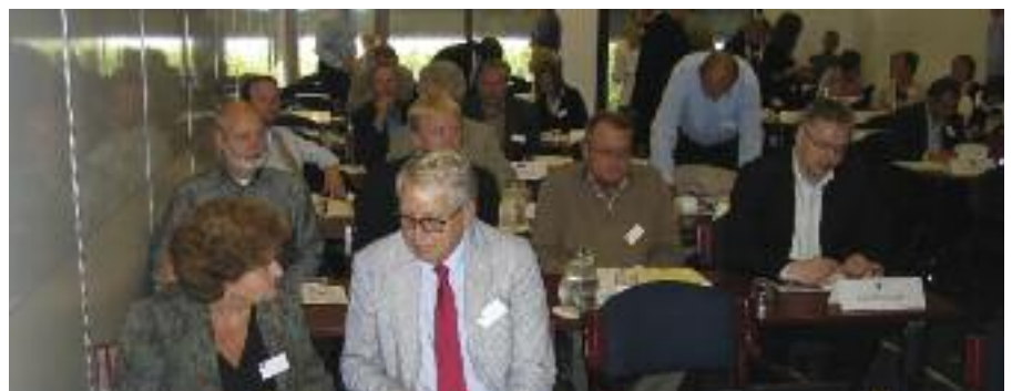
Deltakarar frå Konkurransetilsynet møtte kollegaer frå Danmark, Finland, Færøyane, Grønland, Island og Sverige til fagleg oppdatering og sosialt samvere.

Den danske Konkurrencestyrelsen sto som vertskap for arrangementet, som starta med ein landgjennomgang der deltakarlanda rapporterte frå eiga verksemd. Det vart mellom anna gjort greie for viktige saker, sentrale regelverksendringar, organisatoriske endringar og fokuspunkt.