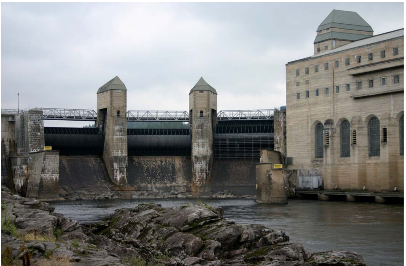
Solbergfoss kraftverk i Askim

Les heile høyringssvaret på www.konkurransetilsynet.no