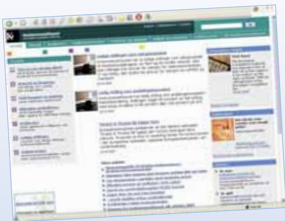
Konkurransetilsynets nye nettsider

Raskere sider, skjema for tips og klager, oversikt over kommande arrangementer og mulighet til å abonnere på nyheter er blant forbedringene på Konkurransetilsynets nye nettsider.