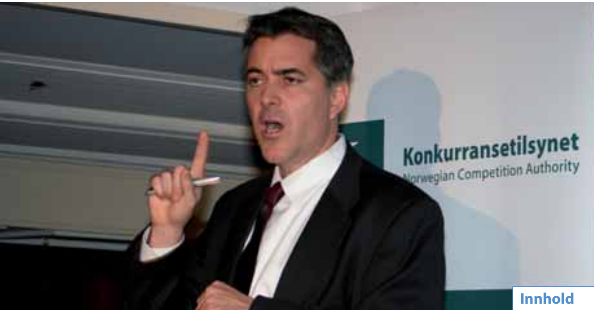
Scott Hammond, U.S. Department of Justice