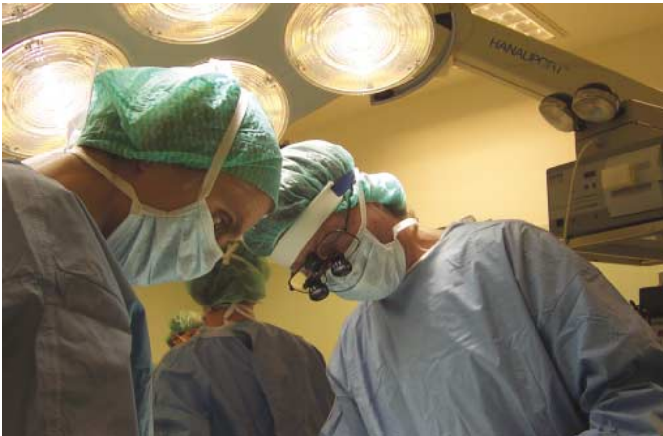
En ny rapport drøfter om konkurranse i sykehussektoren er ønskelig, hvordan konkurranse kan oppnås og hvilke effekter det har.