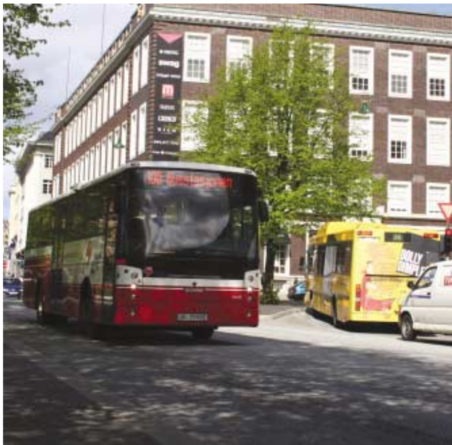
HSD og Gaia får fusjonere.

Konkurransetilsynet vil likevel peike på moglege problem knytt til ei eventuell framtidig konkurranseutsetjing av lokalbusstrafikken i Bergen. Ein føresetnad for effektive anbudsrundar er at alle tilbydarar har tilgang til den nødvendige infrastrukturen – for eksempel busstasjonar og oppstillingsplassar – på like vilkår. Som reguleringsstyresmakter og innkjøparar har kommunen og fylket eit ansvar for å sikre tilgangen til den nødvendige infrastrukturen på ein formålstenleg måte.