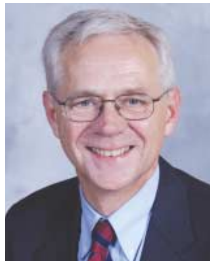
Arbeids- og administrasjonsminister Victor D. Norman

Regjeringen mener at Eierskapstilsynets formål og kompetanse ligger nærmere andre tilsyn på mediefeltet enn