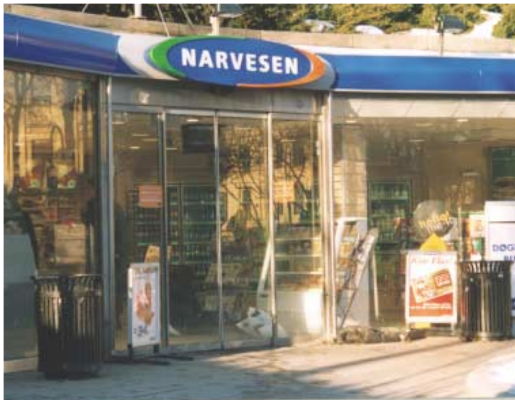
Narvesens franchiseavtaler er omfattet av gruppefritak i EØS-avtalen og trenger derfor ikke dispensasjon etter konkurranseloven.

Konsekvensen av at karantenebestemmelsene ikke er omfattet av fritaket, er at disse må vurderes etter norske konkurranseregler. Den aktuelle bestemmelsen er forbudet mot markedsdeling i § 3-3. Etter en konkret vurdering kom Konkurransetilsynet til at bestem-