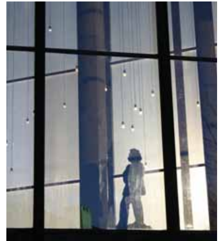
Grieghallen i Bergen

Konferansen koster 1500 kroner inkludert servering. Påmeldingsfristen er 15. februar. For mer informasjon, se www.konkurransetilsynet.no .