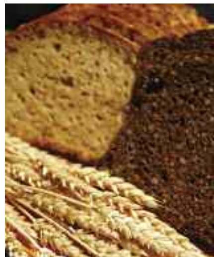
I Danmark har prisene på brød steget mer enn kornprisene tilsier.

Undersøkelsen ble satt i verk våren 2008, etter at matvareprisene hadde økt markant mer i Danmark enn i nabolandene. Undersøkelsen fokuserte på melk, smør, mel og brød, fordi prisene på disse varene hadde steget mest.