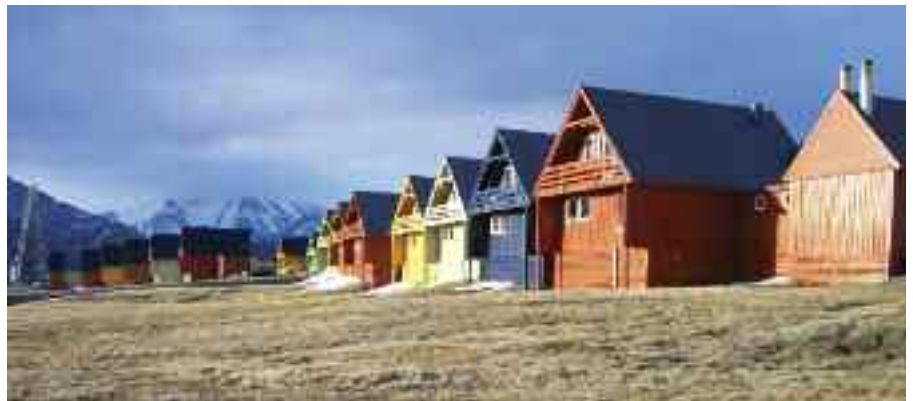
Fra Longyearbyen.

De siste årene har lokale myndigheter og næringsliv gitt uttrykk for at konkur-